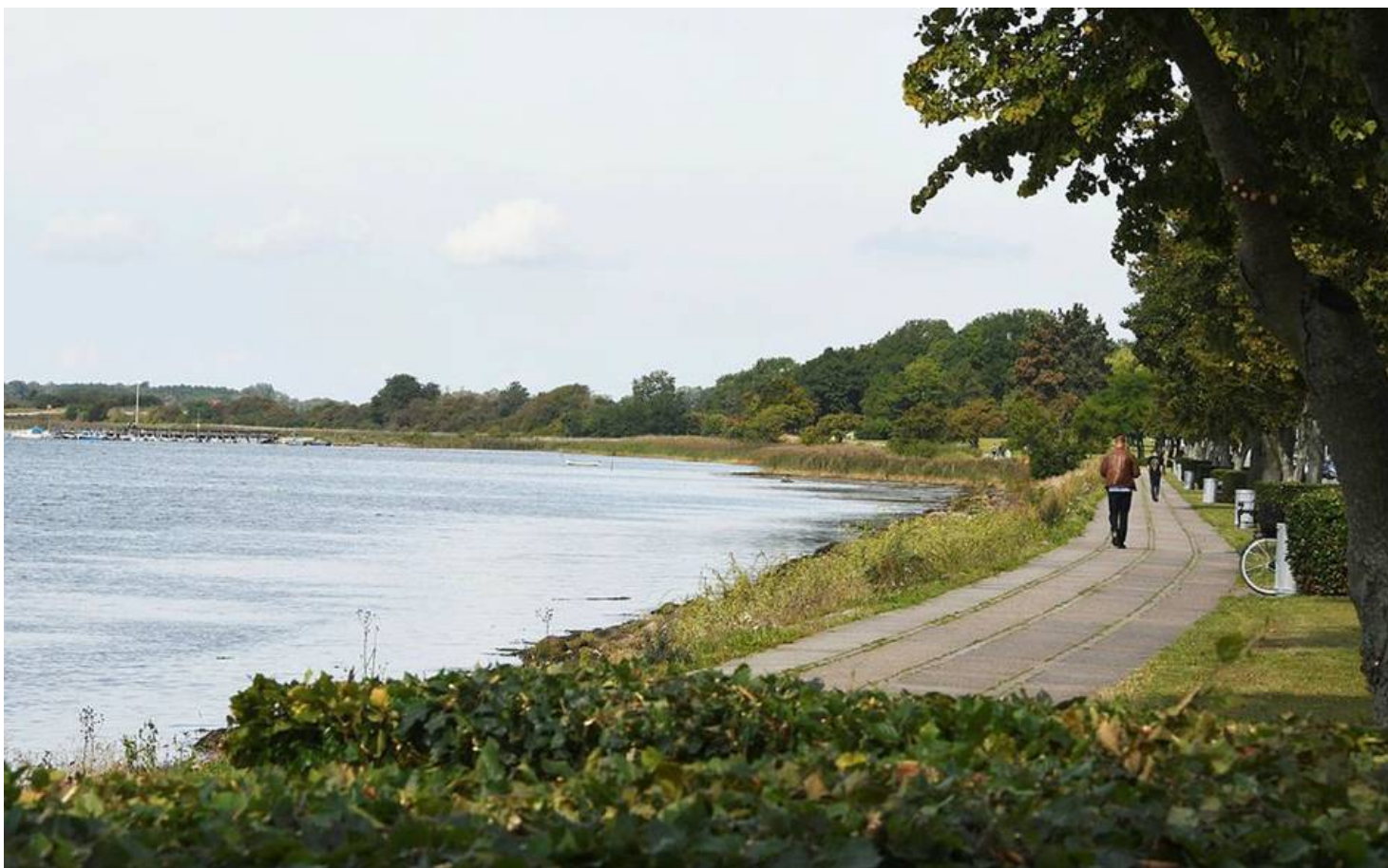
ET STED PÅ STRÆKNINGEN MELLEM NORDRE BÅDELAUG OG SLOTSBRYGGEN (FOTO) LIGGER DER, HVIS DET GÅR EFTER KOMMUNENS PLAN, TIL NÆSTE SOMMER EN BADEBRO OG MÅSKE OGSÅ EN SANDSTRAND. DET SAMME ER TILFÆLDET MELLEM LERGRAVEN OG HASSELØVEJ.